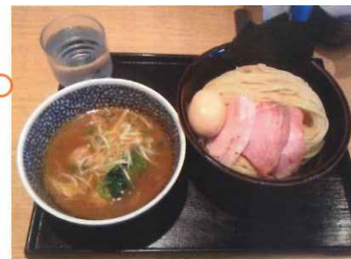
特製濃厚魚介つけ麺 ¥1,080

東京都葛飾区東新小岩 1-4-17 TEL 03-3697-9787 定休日：年末年始