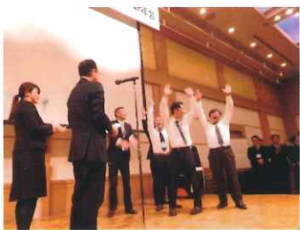
新年会(早食い競争 優勝チーム表彰)