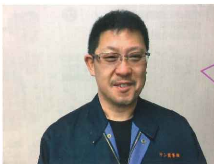
怖そうに見えますが、内面は心優しい大久保です！